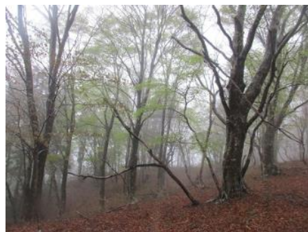
滝谷山ブナ原生林

整備に時間がかかった。ガスがかかり廻りが見えなかった。など、写真が少ないです。申し訳ありません。