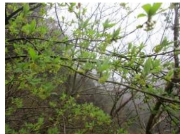
クロモジ 次のページへ