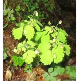
サンインシロガネソウ