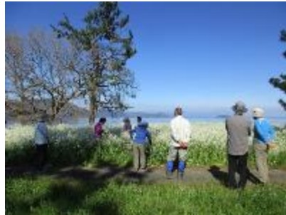
今津桂浜の大根花群生地にて②

みなさん、「黄色の菜の花 良いけど、大根花の白色・ 紫がかった色も良いね・・・」 などと植物談義に花咲かせました。