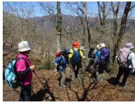
ニオイコブシの香りを確かめる