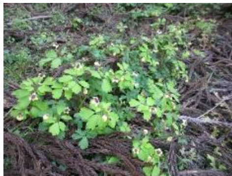
サイインシロガネソウ