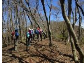
眺望を楽しみながら