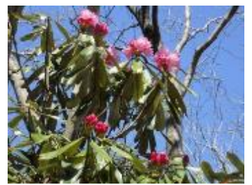
二の谷山山頂にて