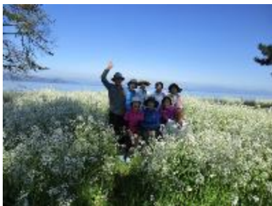
今津桂浜の大根花群生地にて①