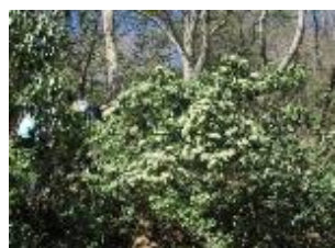
アセビ：今年はお花が多い