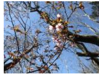
キンキマメザクラ