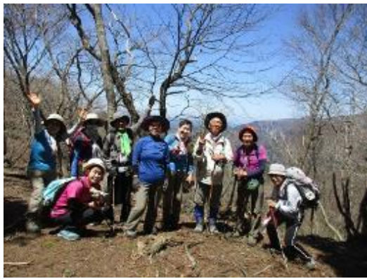
二の谷山山頂にて