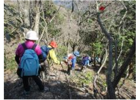
足元に注意して。急坂を下りる。