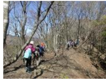
きれいな樹林を行く