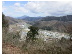
燧ヶ城跡からの眺望