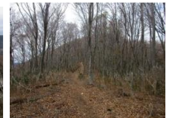
ブナ原生林と藤倉山