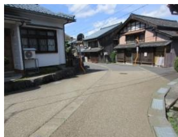
矩折 (かねおり) (枡形：ますがた)