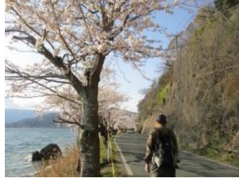
海津大崎の桜は満開