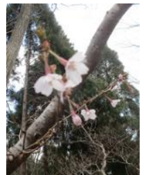
キンキマメザクラ