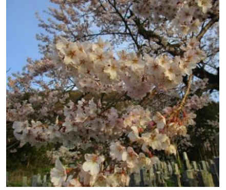
アズマヒガンザクラ