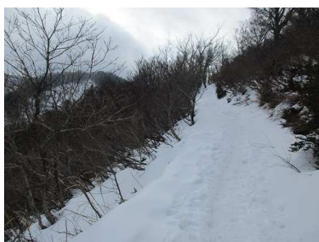
眺望を楽しみながら