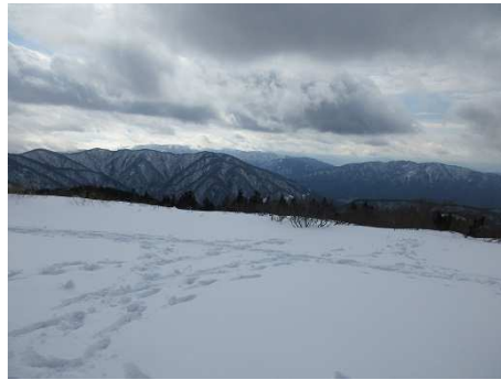
360度の眺望を楽しみましょう