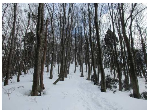
気持ち良いブナ原生林ウォーク