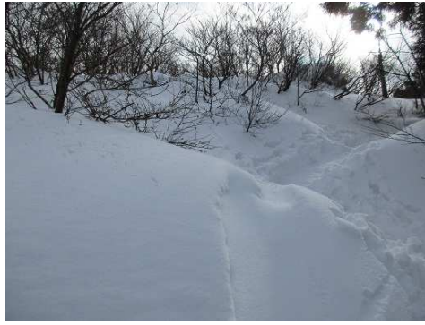
山頂の積雪は、やはり多い