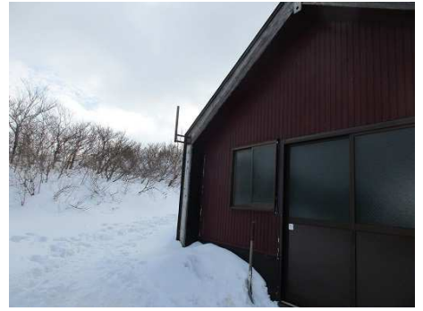
避難小屋 雪が降っても安心