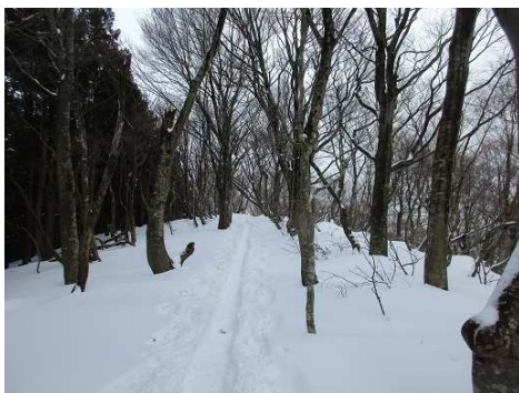
ブナ原生林に入る