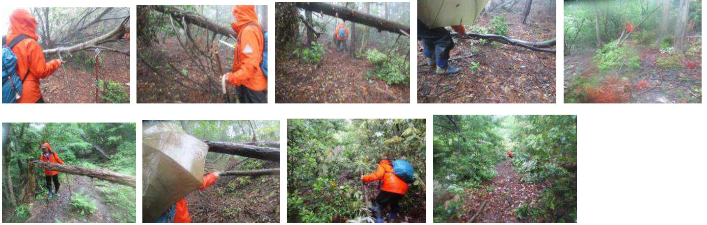
◆トレッキングコースの状況、観察ポイント シシガキ↓