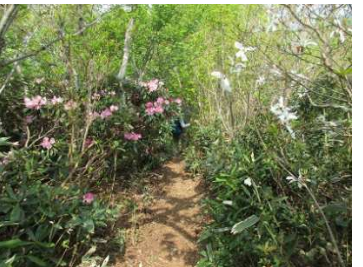
しゃくなげが綺麗