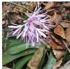
ショウジョウバカマ