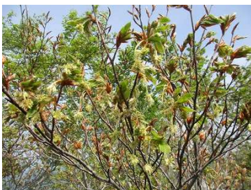
ブナの雄花・雌花