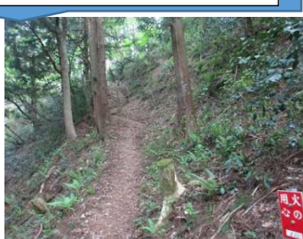
綺麗な樹林を行く