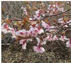
キンキマメザクラ