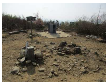
富士写ヶ岳山頂・一等三角点