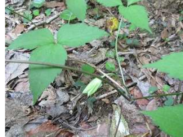
トリガタハンショウヅル①