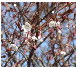
キンキマメザクラ