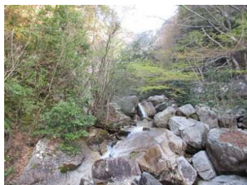
楊梅の滝登山口からのぼる。