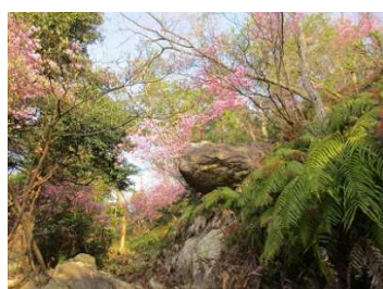
コースに咲く ミツバツツジの花①