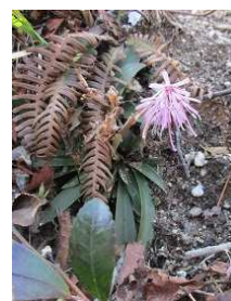
ショウジョウバカマ