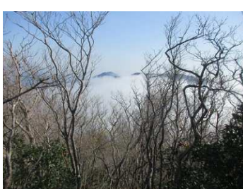
ヤケ山からの雲海