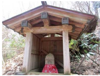
万路越のお地藏さん