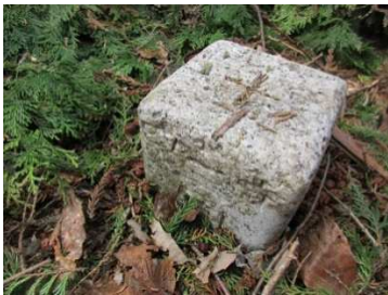
峯山 4等三角点 531.8m