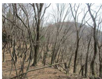
きれいな自然林の尾根コースに行く