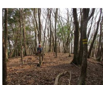
分岐：大崎寺方面へ