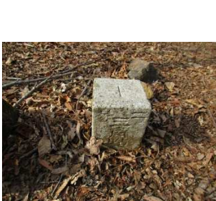
東山山頂2等三角点