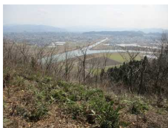
アチコチから福井市内の眺望など楽しめます