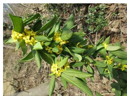
チンチョウゲ科のナニワズです。 あちこち綺麗に咲いています。