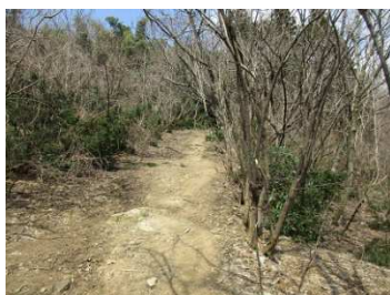
気持ち良い里山歩きです