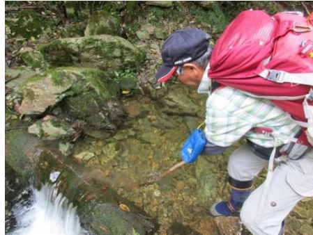
いきなり沢：詰まっているのでお掃除①