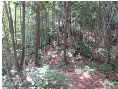
きれいな樹林：以前に比べ整備されていて日差しが一杯で気持ち良い